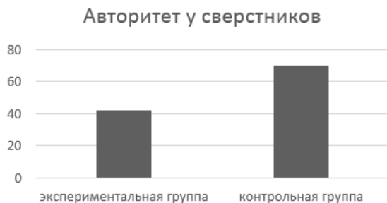
Рис.2. Самооценка: авторитет у сверстников

Значимые различия были обнаружены по шкале самооценки «Авторитет у сверстников» (подростки с РАС имеют более низкие оценки по этой шкале), а также по шкале «Уровень притязаний: характер» (здесь притязания экспериментальной группы оказались более высокими, чем у контрольной группы). Различия представлены на рисунках 2 и 3.