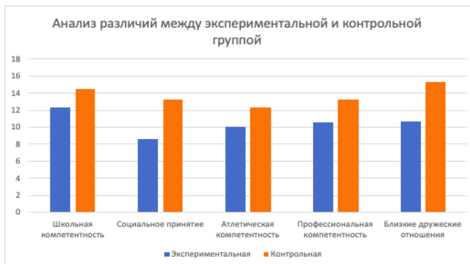
Рис. 1. Результаты по опроснику «Профиль самовосприятия для подростков» С. Хартера

Полученные данные указывают на то, что подростки с РАС, по сравнению с группой нормы, оценивают свои способности в учебной деятельности намного ниже, им свойствен низкий уровень восприятия собственной популярности среди ровесников, а также представлений о том, как к нему относятся другие. Низкая оценка аутичными подростками своей атлетической компетентности может быть связана с ограниченным восприятием подростками образа своего тела. В профессиональной сфере аутичные подростки, по сравнению с подростками группы нормы, также воспринимают себя низкоэф-